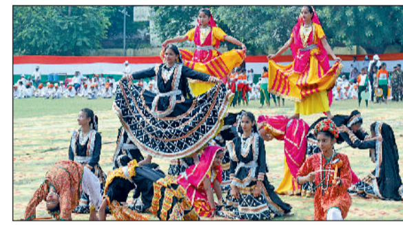
नारनौल। समारोह में सांस्कृतिक कार्यक्रम प्रस्तुत करते विद्यार्थी। सम्मानित होने वाले अधिकारियों व कर्मचारियों की सूची।

79वां स्वतंत्रता दिवस समारोह जिला में बड़े उत्साह व हर्षोल्लास के साथ मनाया गया। आईटीआई में हुए जिला स्तरीय समारोह में हरियाणा के राजस्व एवं आपदा प्रबंधन मंत्री विपुल गोयल ने राष्ट्रीय ध्वजारोहण किया। उन्होंने परेड का निरीक्षण किया और मार्च पास्ट की सलामी ली। विभिन्न विद्यालयों की टीमें ने देशभक्ति से ओत-प्रोत सांस्कृतिक कार्यक्रम प्रस्तुत किए। इससे पहले मुख्य अतिथि ने जिला सैनिक बोर्ड में शहीद स्मारक पर पहुंचकर शहीदों को श्रद्धांजलि अर्पित की। उन्होंने मंच पर वीरगानाओं तथा स्वतंत्रता सेनानियों के परिजनों को भी शाल आढ़ाकर सम्मानित किया।