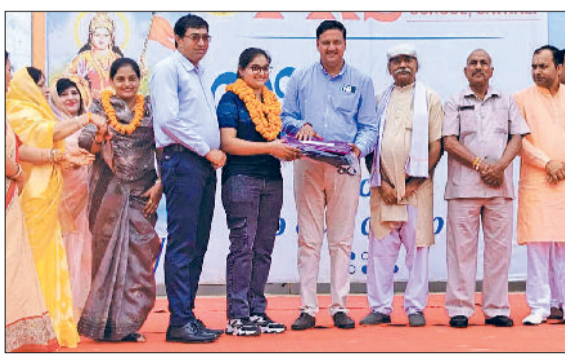
महेन्द्रगढ़। कार्यक्रम में अपनी प्रस्तुति विद्यार्थी। व सतनाली। कार्यक्रम में विशेष उपलब्धि पर छात्रा को सम्मानित करते प्राचार्य व अन्य।