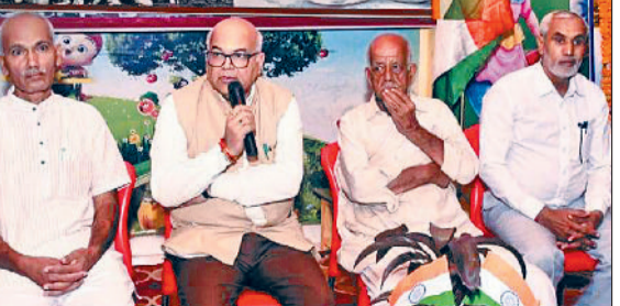
महेन्द्रगढ़। विद्यार्थियों को संबोधित करते हुए।

भारत माता के चित्र के समक्ष दीप प्रज्वलन किया। प्रोफेसर टंकेश्वर कुमार ने कहा कि आखिर बंटवारा हुआ ही क्यों? यदि बंटवारा