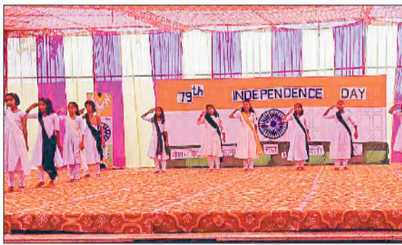
महेन्द्रगढ़। सांस्कृतिक कार्यक्रम में प्रस्तुति देते विद्यार्थी।